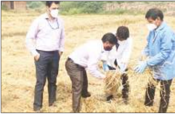
सर्दियों में पराली जलाने के मुद्दे पर आप सरकार गंभीर