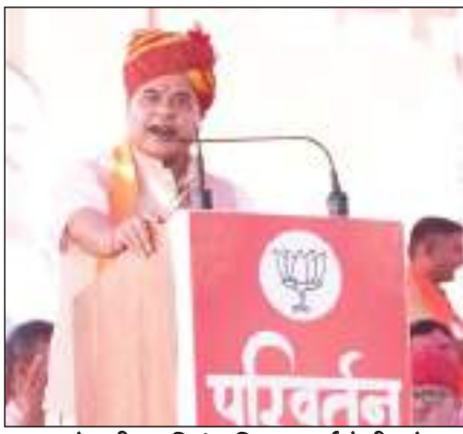
असम के सीएम हिमंत बिरुव सर्मा रैली को संबोधित करते हुए।